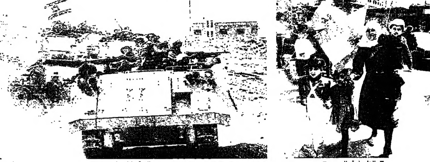
العلم فوق الجميع

بدأت كثيبتان من الجيش اللبناني بالانسحاب من النبطية بعد ظهر امس. وذلك بعد انسحاب الجيش الاسرائيلي من القطاع في الصباح. وقد دخلت المدينة ثلاث ثلاثات جند وسيرات جيب فيما اكدت مصادر عسكرية ان كثيبتين من اللواء الثاني سوف تنتشر في المنطقة. وكان الجيش الاسرائيلي انسحب في الساعة العاشرة من صباح امس من منطقة النبطية بجنوبي لبنان التي تضم عددا من السكان يتراوح ما بين ستين الفا وسبعين الف نسمة معظمهم من اصل شعبي. ويشير المراقبون الى ان هذا القطاع الذي يضم قرى الانصار والدور والحوش. كان في الاونة الاخيرة مسرحا لهجمات عنيفة واعتداءات ضد الجيش الاسرائيلي. وكان كل من اسحق رابين وزير الدفاع الاسرائيلي والجنرال موشي ليفي القائد العام للجيش الاسرائيلي والجنرال اوري اور قائد المنطقة الشمالية اشرفوا على عملية الانسحاب من النبطية. وذكر مصدر عسكري اسرائيلي ان الانسحاب من منطقة النبطية يدخل في اطار المرحلة الثانية من انسحاب الجيش الاسرائيلي. وأضاف ان نقل المسجونين من معسكر الانصار في النبطية للمضي الى اسرائيل ونسف هذا المعسكر اتاحا للجيش ان ينسحب من القطاع الاوسط في الجنوب اللبناني. وفي القطاع الشرقي سينسحب الجيش الاسرائيلي ايضا بالتاكيد من الجزء الجنوبي من سهل البقاع ومن جبل البروك ومن المواقع التي يحتلها شمالي جبل الشيخ قبل نهاية شهر ابريل - نيسان الحالي لينتهي المرحلة الثانية من انسحابه. حيث لن ينتشر الجنود الاسرائيليون بعد ذلك الا جنوبي نهر الليطاني. وذكر الجنرال اوري اور قائد المنطقة الشمالية صباح امس ان المرحلة الثالثة والاخيرة من الانسحاب الى الحدود الدولية ستنتهي في بداية او منتصف شهر يونيو - حزيران المقبل. وصرح الجنرال ليفي من جانبه بان